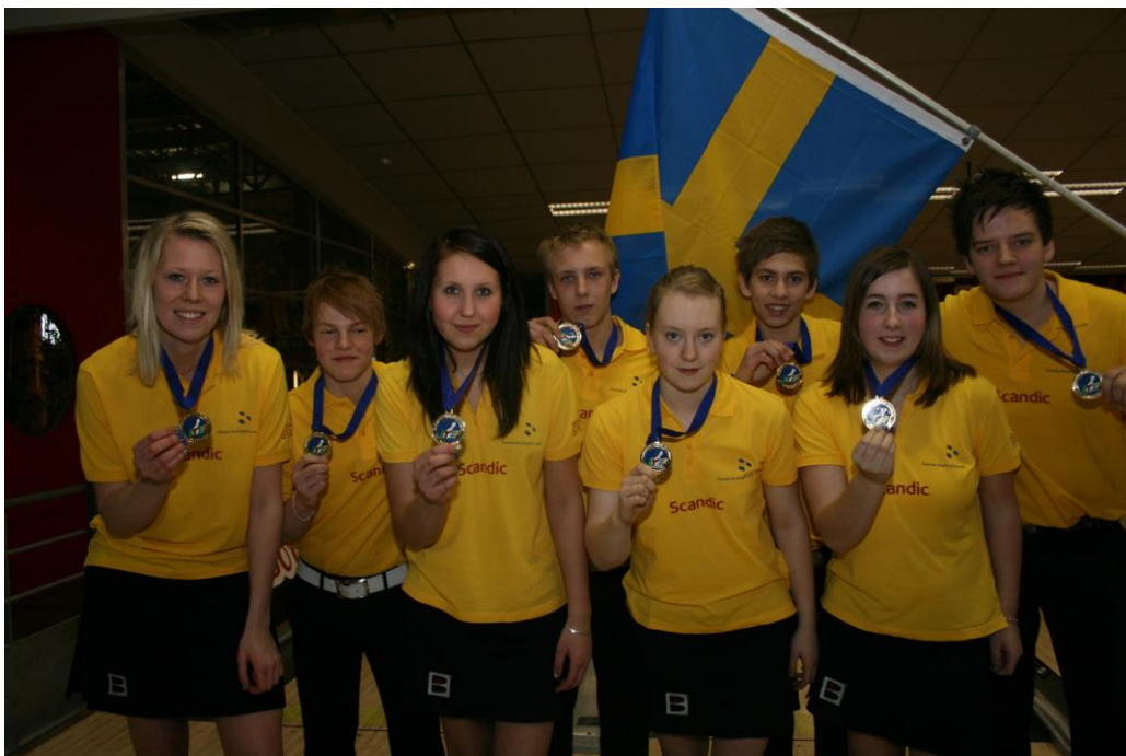
Glada medaljörer från Junior EM i Paris 2010