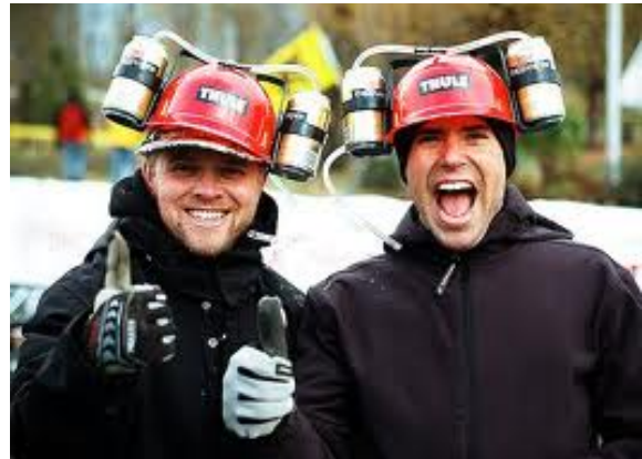
Typiskt funktionell mössa.

Förutom en klassisk stickad mössa är olika funktionella kreationer populära vid sidan av vikingahornen som får anses utgöra själva kungahatten.