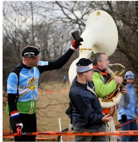
En riktig widowmaker".

Men det finns förstås också tyngre pjäser att tillgå.