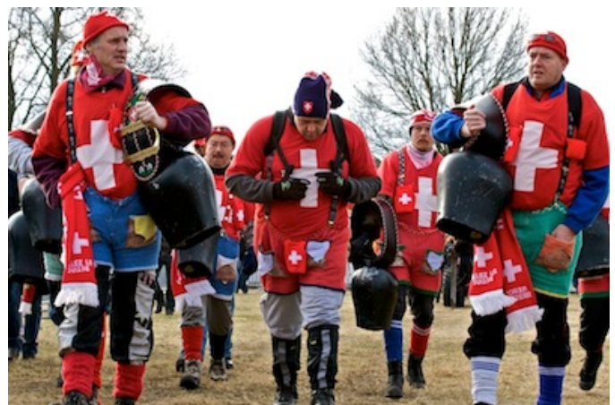
Segervissa män från Schweiz gör entré.

- bjällra: våra vänner från Schweiz är föregångsmän på området bjällror. Förutom den mäktiga klangen och respektingivande uppenbarelsen har bjällrororna svarat för åtskilliga övernattningar utanför grindarna. Många menar att schweizarna har de väldiga bjällrororna att tacka för att landet förblev neutralt.